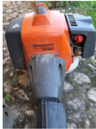
10.- Desbrozadora rota.