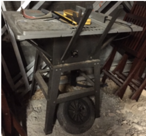
9.3- Herramientas taller mesa corte madera.