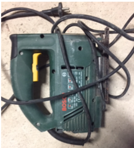
19.2- Herramientas Maquina Calar.