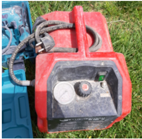
2.- Bomba Comp Elect RP Pro III.