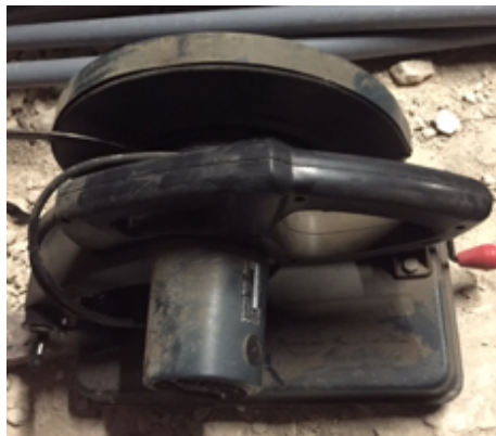
9.1- Herramientas de taller Engletadora Hierro.