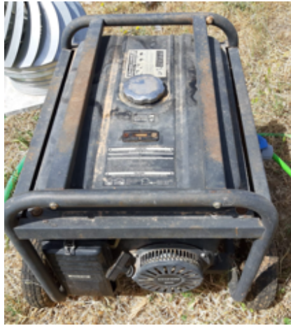
1.- Grupo electrógeno 6KVA Gasol.