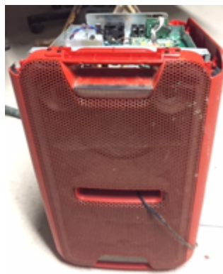
25.- Altavoz Sony