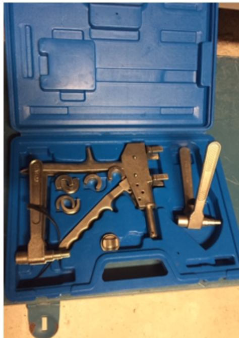
19.13- Herramientas prensa Barby.