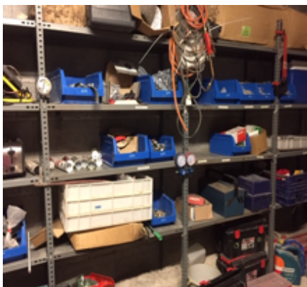
21.Gavetas varias diferentes tamaños