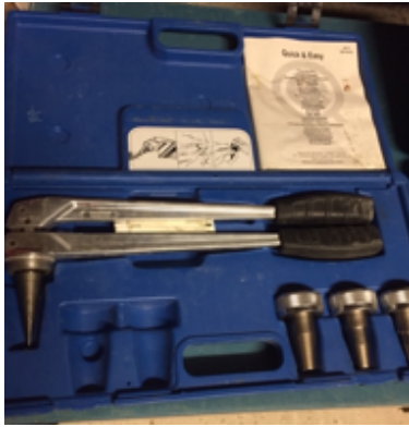
19.14- Herramientas Prensa Uponor.