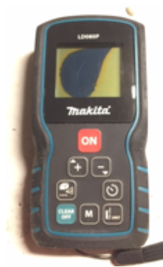
19.11- Herramientas Medidor Laser.