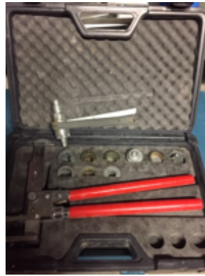
19.15- Herramientas Prensa Barby.