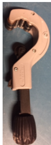
19.9- Herramientas Cortatubos Inox.