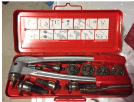
5.- Prensa Montaje.