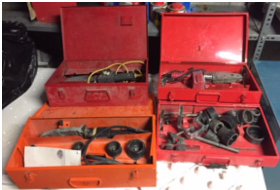
19.10- Herramientas Maquinas Termofusión.