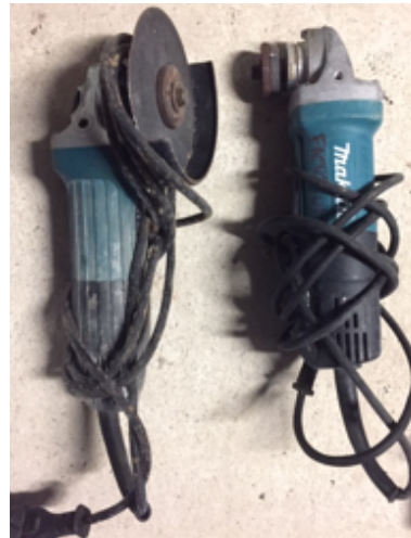
19.1- Herramientas Amoladoras.