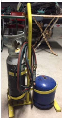
19.8- Herramientas Grupo Soldadura Fuerte.