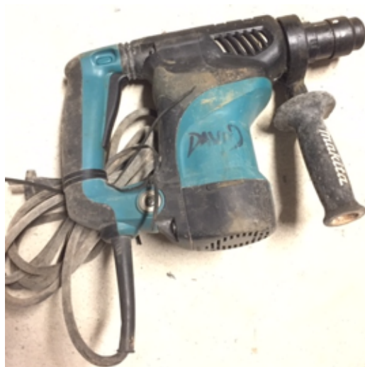
19.3- Herramientas Martillo Percutor