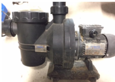
19.6- Herramientas Grupo Piscina LP600.