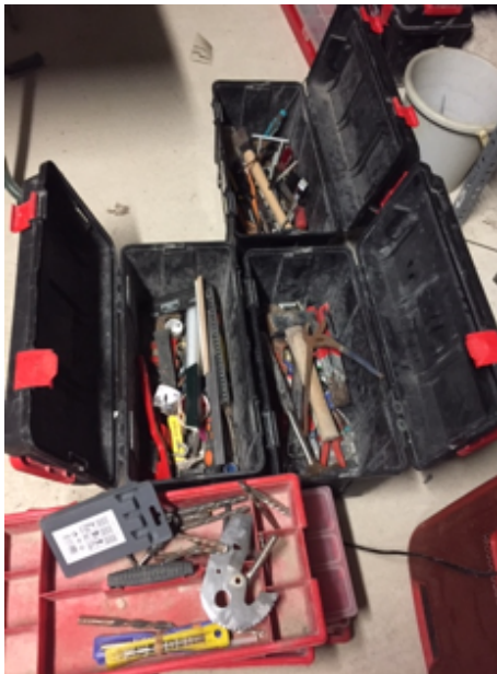
19.12- Herramientas varias.