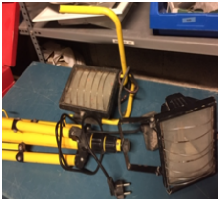
19.16- Herramientas Focos.