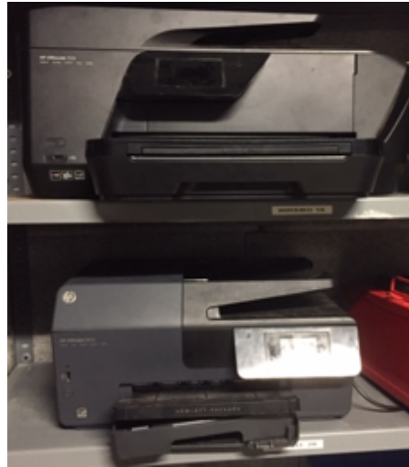
26 Y 27.- Impresoras.