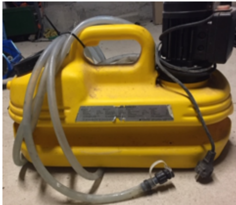
19.5- Herramientas grupo descalcificación.