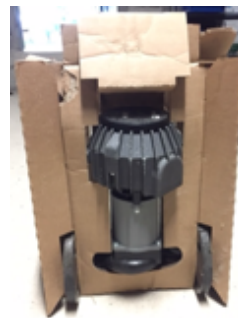
19.7- Herramientas Grupo Presión Ebara.