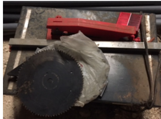
9.2- Herramientas taller mesa corte hierro.