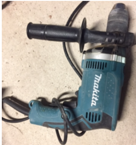
19.4- Herramientas Taladro.