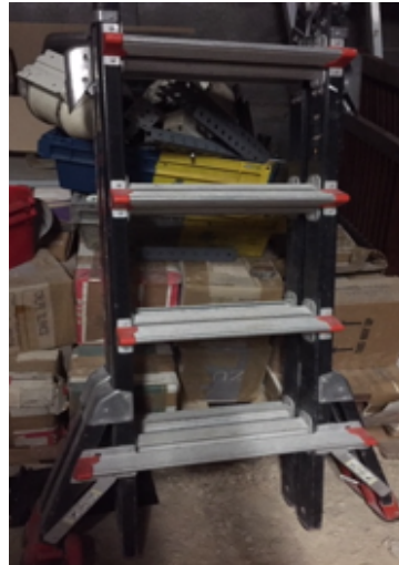
7.- Escalera articulada.